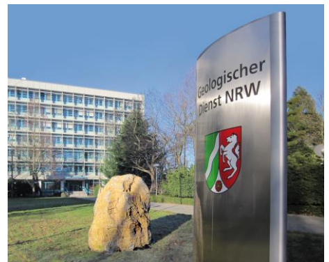
Geologischer Dienst NRW in Krefeld

Über die geplanten bodenkundlichen Kartierungen werden die betroffenen Kreisverwaltungen sowie die zuständigen Landwirtschaftskammern und Regionalforstämter rechtzeitig schriftlich informiert. In der Regel werden die Informationen im Amtsblatt oder durch Aushang veröffentlicht. Es wird um Verständnis dafür gebeten, dass eine persönliche Unterrichtung bei der Vielzahl von Grundstückseigentümer*innen oft nicht möglich ist.