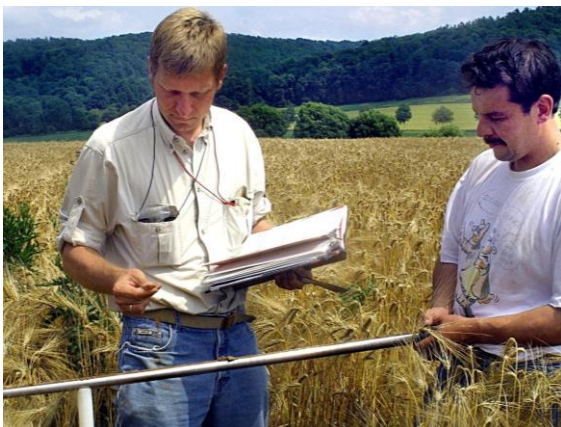
Beurteilung der Bodeneigenschaften durch den Geologischen Dienst

Demnach sind die Mitarbeiter*innen und Beauftragten des Geologischen Dienstes NRW berechtigt, Grundstücke – nicht die Gebäude – zu betreten und die notwendigen Arbeiten vorzunehmen. Auf forstliche und landwirtschaftliche Belange und die Nutzung der Grundstücke wird soweit wie möglich Rücksicht genommen. Falls trotzdem durch die Arbeiten Schäden entstehen, werden diese nach den allgemeinen gesetzlichen Bestimmungen ersetzt.